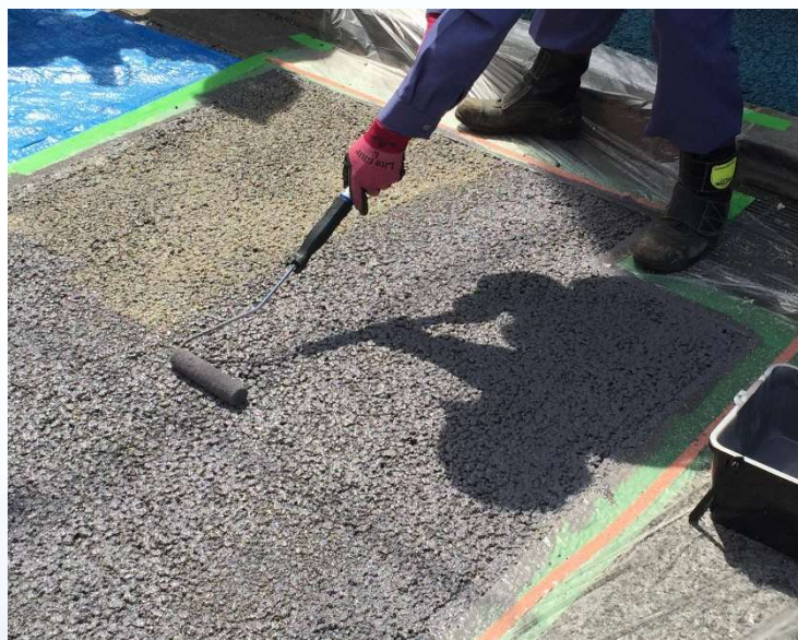
同封のローラーで簡単に施工出来ます